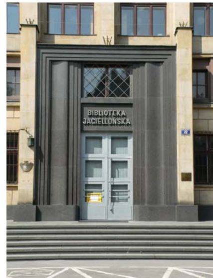
Haupteingang Aleja Mickiewicza