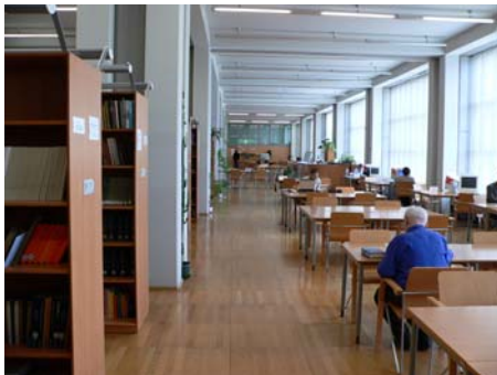
Lesesaal für wissenschaftliche Information

Die bibliographische Abteilung wurde 1951 gegründet, die Katalogabteilung 1964. In den Jahren 2004/2005 wurden die beiden Abteilungen zur "Abteilung für wissenschaftliche Information und Kataloge" vereinigt. Zur Abteilung gehören der Lesesaal für wissenschaftliche Information mit der Informationstheke und der Katalogsaal nebst Katalogauskunft. Im Lesesaal für wissenschaftliche Information sind ca. 11600 Bände Nachschlagewerke aufgestellt (Literaturauswahl durch bibliothekarisches Fachpersonal der Abteilung). Außerdem findet der Leser hier 11 Internetarbeitsplätze und 2 Computer für die Nutzung nicht netzwerkfähiger CD-ROM. Die Zettelkataloge für die Altbestände der BJ sind in einem eigenen Saal aufgestellt. Im Vorraum des Lesesaals für Nachschlagewerke befinden sich Computer, an denen ausschließlich der Online-Katalog und die digitalisierten Zettelkataloge benutzt werden können. Hier werden auch Neuerwerbungen der BJ präsentiert. Die Vitrinen werden alle zwei Wochen neu bestückt.