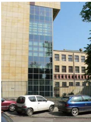
Übergang Altbau-Erweiterungsbau Südseite ...