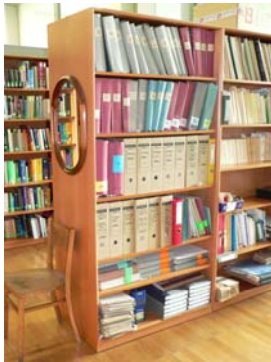
Archiv der Leseranfragen