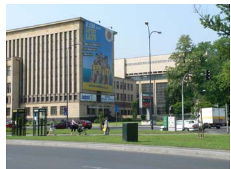
... und Nordseite