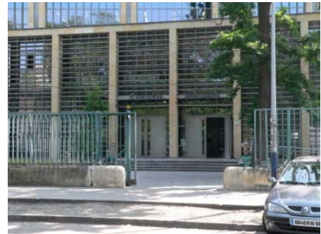
Eingang Ulica Oleandry