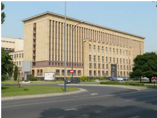
Ansicht von der Aleja Mickiewicza aus

Art déco. Es strahlt außen wie innen eine schlichte Vornehmheit aus. Der Magazin- und Verwaltungsbau ist als Querriegel parallel zur Straße angeordnet, ein deutlich niedrigerer Trakt mit dem großen Hauptlesesaal ist mittig an die Rückseite angesetzt. Dieser Gebäudeteil wurde in den Jahren 1961 bis 1963 erweitert.