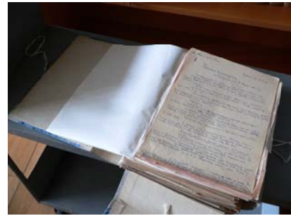
Die älteste aufbewahrte Anfrage aus dem Jahre 1950

Die Abteilung beantwortet pro Jahr mehr als 500 schriftliche Anfragen aus dem In- und Ausland. An die Informationstheke werden pro Jahr ca. 18000 mündliche Anfragen gerichtet. Sämtliche seit 1950 eingegangenen schriftlichen Anfragen und die Antworten werden archiviert. Ein Schlagwortregister zum Anfragen-Archiv ermöglicht den Mitarbeitern, Material zu häufig gestellten Fragen oder Recherchen, die besonders aufwändig waren, wieder zu finden und so Doppelarbeit zu vermeiden. Diese Arbeitskartei wird zurzeit zu einer Datenbank umgearbeitet.